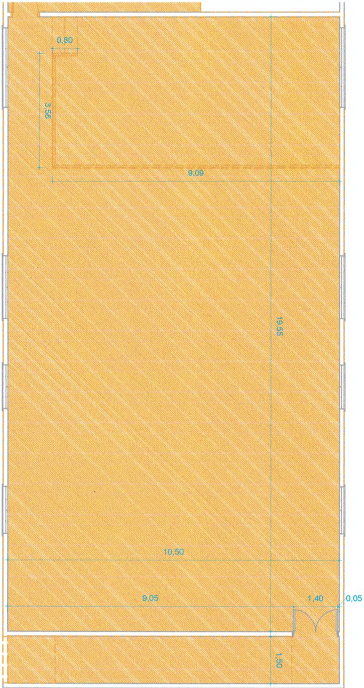
1 PLANTA DEMOLIÇÃO 1 : 75